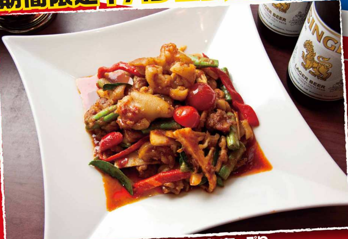
プリプリ!ピリ辛!やわらか!コラーゲンたっぷり 豚足煮込みとインゲンのレッドカレー炒め 「パツ・パツ・カームー」ビールに最高によく合います! ¥980 0-01 PHAD PED KAH MOO (Stir-fried Spicy Pork Leg with Red Curry)