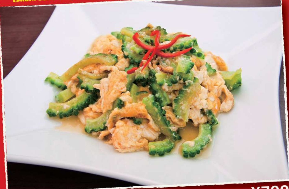
タイ風ゴーヤーチャンプルー ¥700 「パット・マラ・サイ・カイ」 ゴーヤーはタイでは年中食べてるポピュラーな野菜。バンコクの食堂気分どうぞ! 0-02 PHAD MARA SAI KAI (Stir-fried Gourd with Egg)