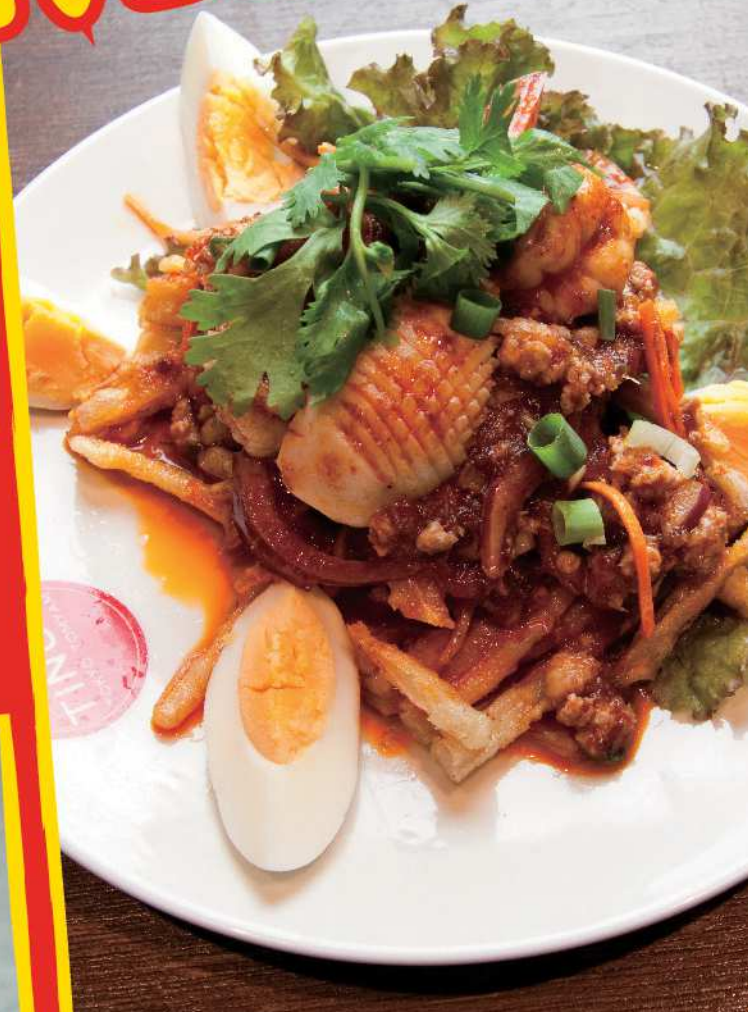
旬の揚げごぼうと シーフードの甘辛サラダ 「パー・ごぼう・クローブ」🌶️ ¥880 N-03 PAH "GOBOU" KLOBE (Spicy & Sweet Salad with Burdock & Seafood) 食物繊維たっぷりの旬のゴボウを ビールによく合う甘辛サラダで!