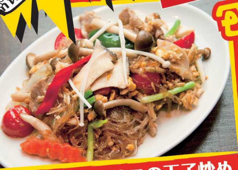
春雨と旬のキノコの玉子炒め 「パット・ウンセン・サイ・ヘツ」 N-02 PHAD WOONSE SAI HED (Stir-fried Mushrooms & Vermicelli with Egg) ¥780 秋の味覚キノコを優しい味わいの春雨炒めで